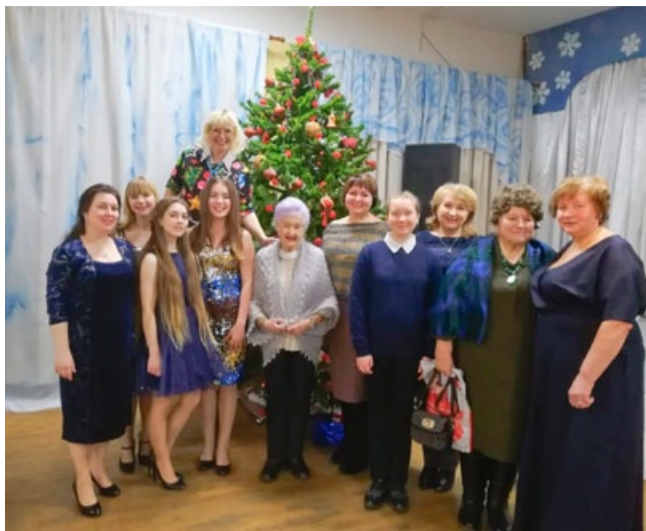
Организаторы и исполнители.

Тепло приветствовали собравшихся заместитель Председателя Совета депутатов, председатель Президиума Подольского отделения ВЖС «Надежда Рос-